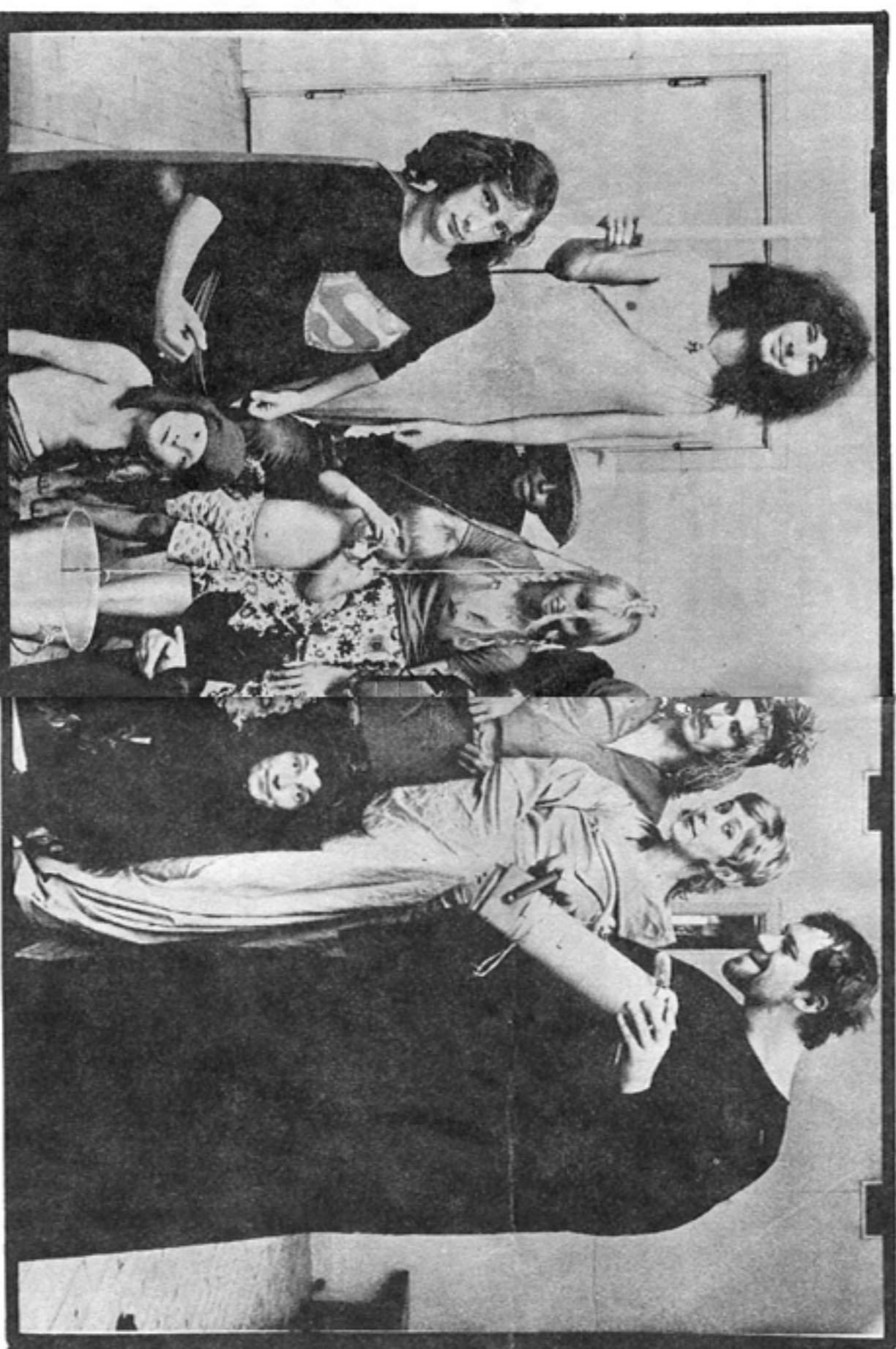
Nationalteaterns finska i Örebro och jobbar just ut i Hisingrs backa.

De tycker när att jag skriver låsset under blåppen. Vill du säga att jag skriver låsset under blåppen. Vill du säga att jag skriver låsset under blåppen. Vill du säga att jag skriver låsset under blåppen.