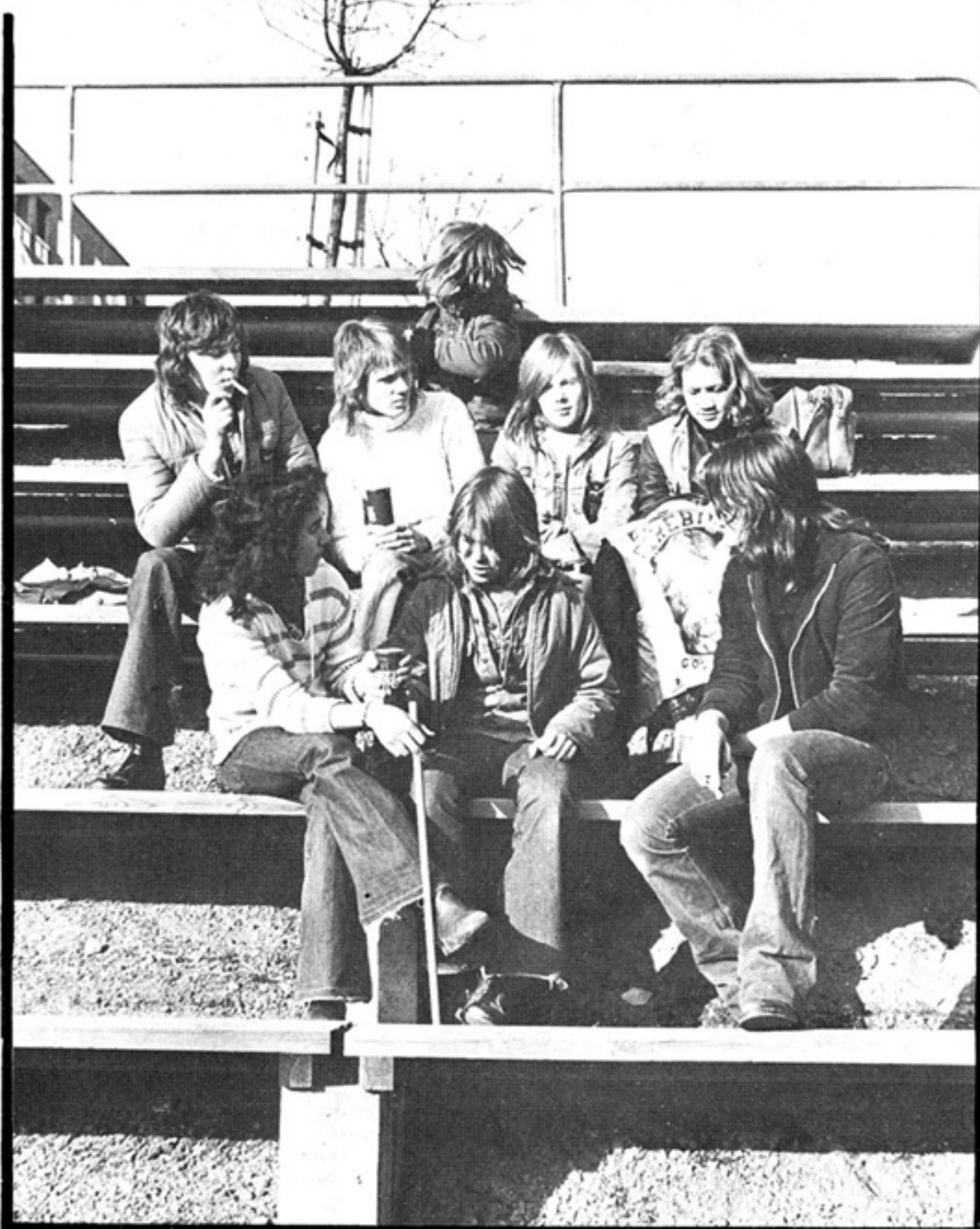
Förebyrå i Hjälp utansför Göteborg skilde upp när