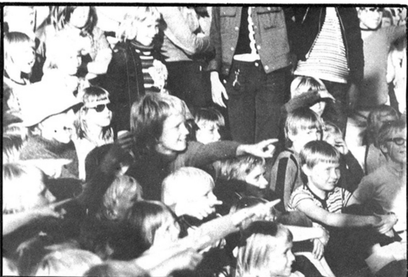
Nationalteatern spelar Sagan om ornen för en mängd barn i Göteborg nån stans.